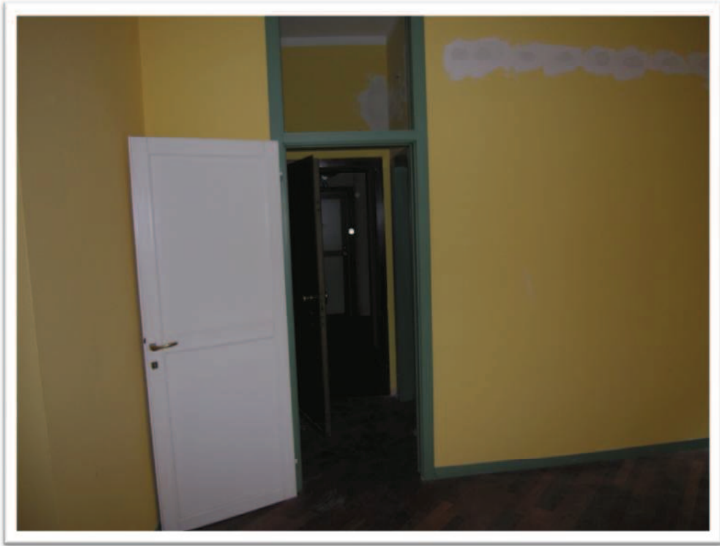
Ingresso e soggiorno.