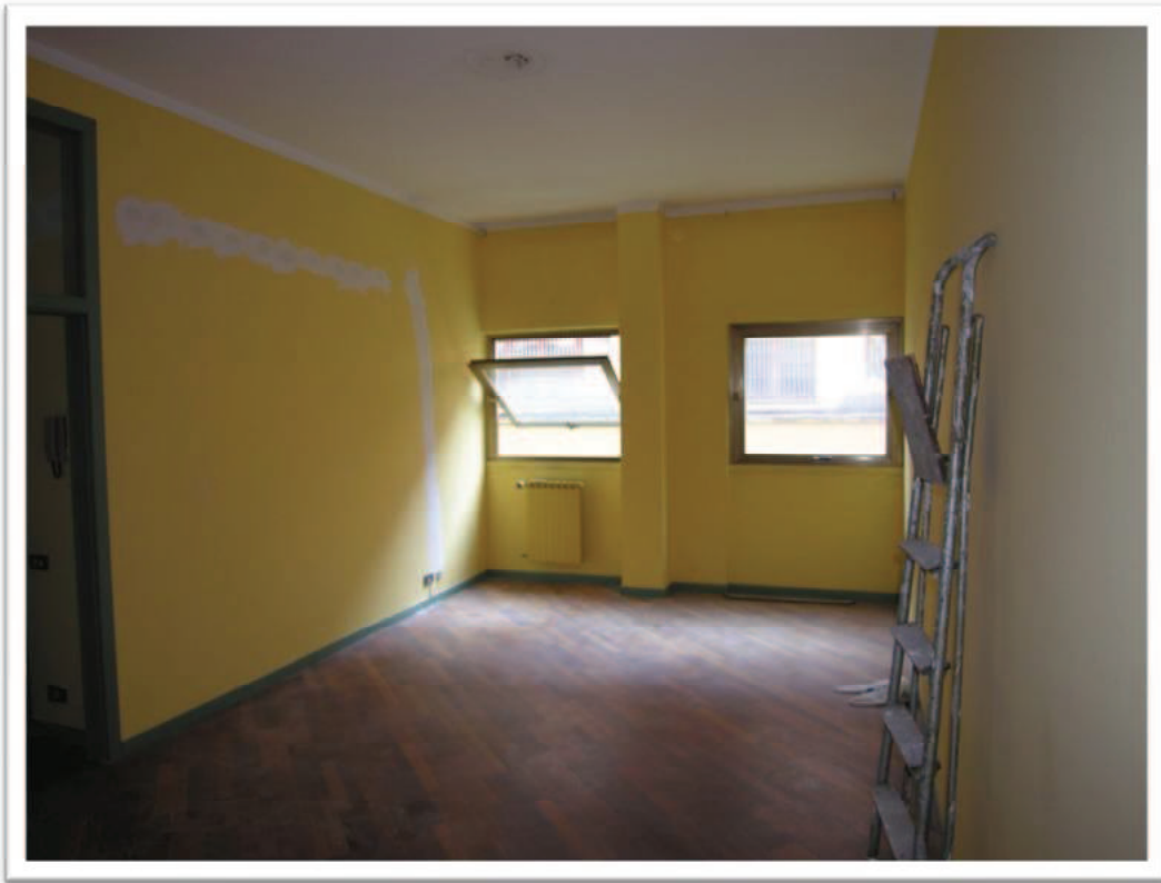
Altre viste del soggiorno.