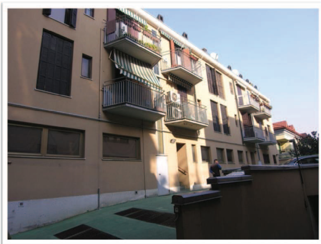
La palazzina vista dal cortile interno e cortile.