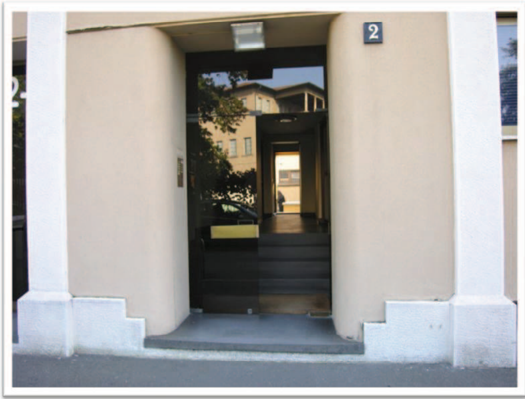
Particolare degli ingressi condominiali dai civici n. 2 e n. 4.