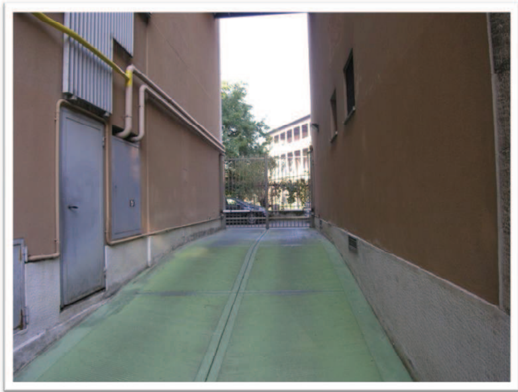
Accesso carraio dall'interno e rampa carraia.