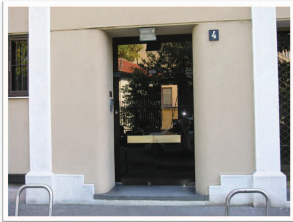
L'ingresso condominiale da strada della Simonetta, 4.