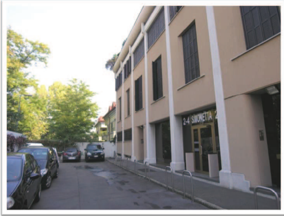
Vista del palazzo condominiale su strada della Simonetta.