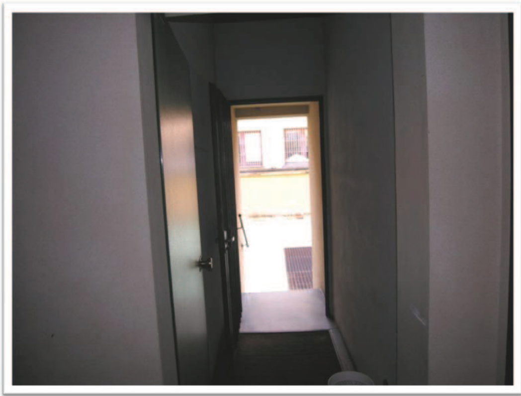
L'uscita verso il cortile interno e l'ingresso all'alloggio.