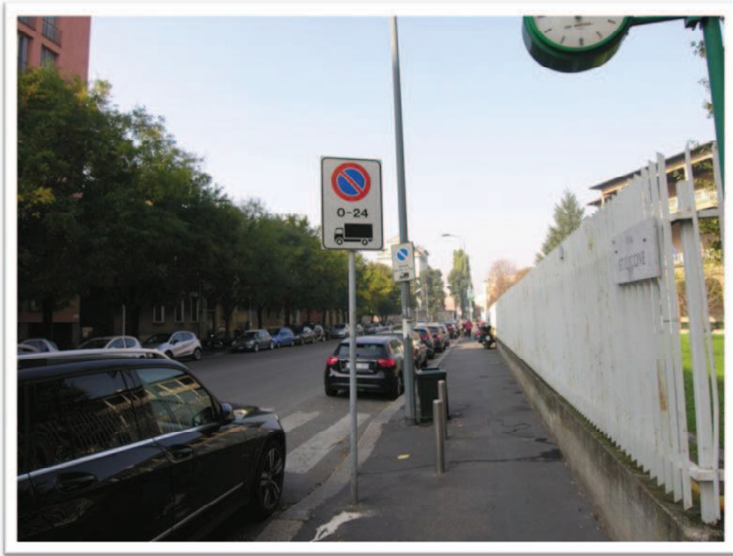
L'intorno verso via Stilicone ed ingresso carraio su strada della Simonetta.